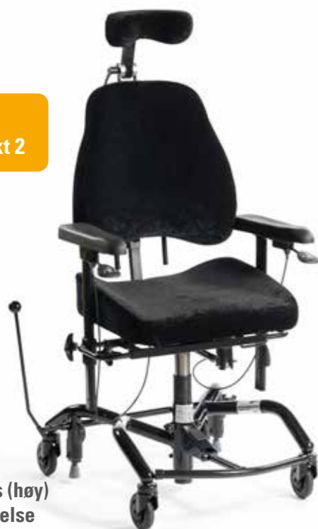
Real 9000 Plus (høy) standard utførelse