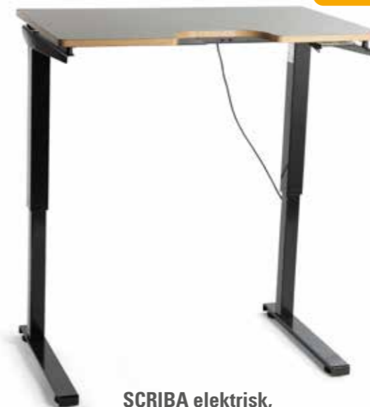
SCRIBA elektrisk, hel, fast bordplate