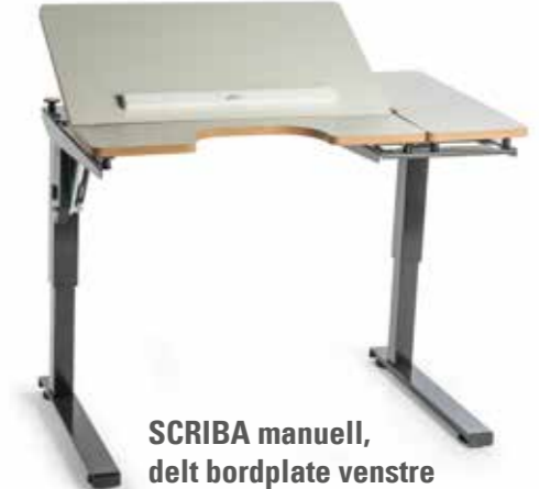
SCRIBA manuell, delt bordplate venstre