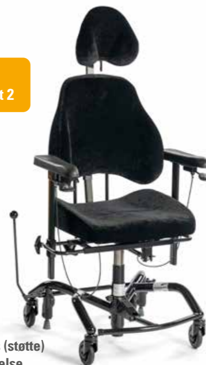
Real 9000 Plus (støtte) standard utførelse