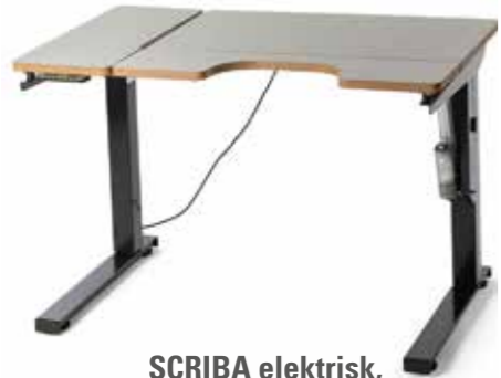
SCRIBA elektrisk, delt bordplate høyre