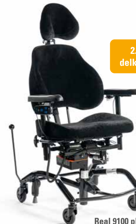
Real 9100 plus EI 24V (støtte) standard utførelse