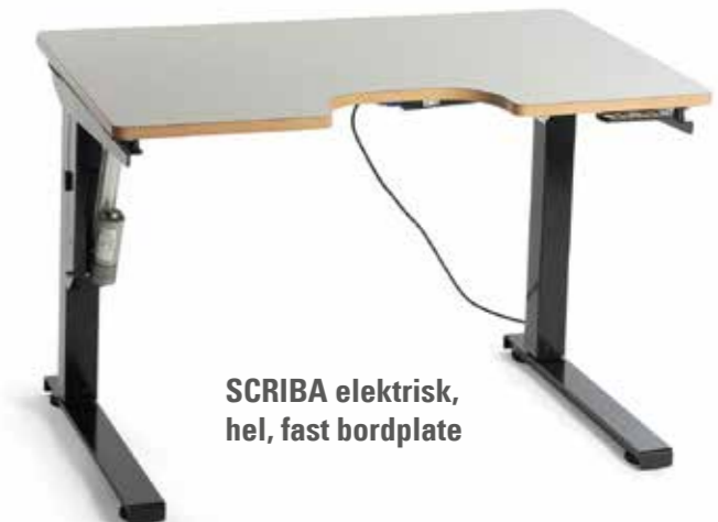
SCRIBA elektrisk, hel, fast bordplate