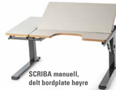
SCRIBA manuell, delt bordplate høyre