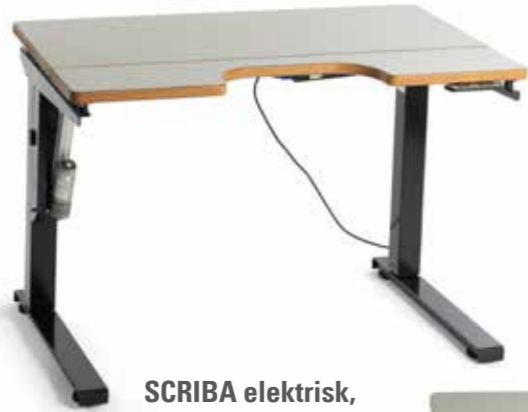
SCRIBA elektrisk, hel bordplate