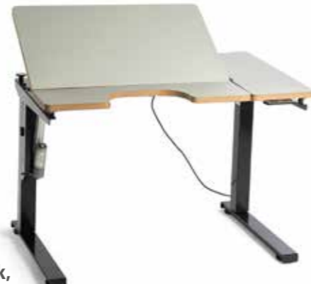
SCRIBA elektrisk, delt bordplate venstre