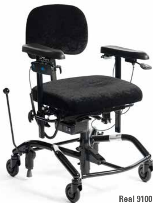
Real 9100 Plus EL 24V (aktiv) standard utførelse