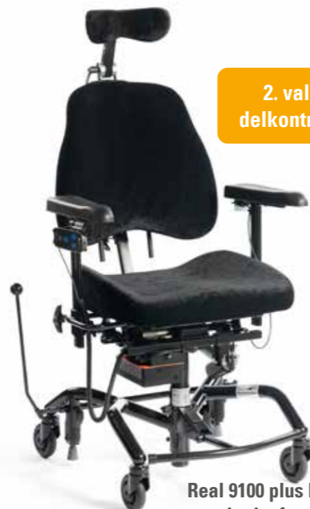
Real 9100 plus EI 24V (høy) standard utførelse