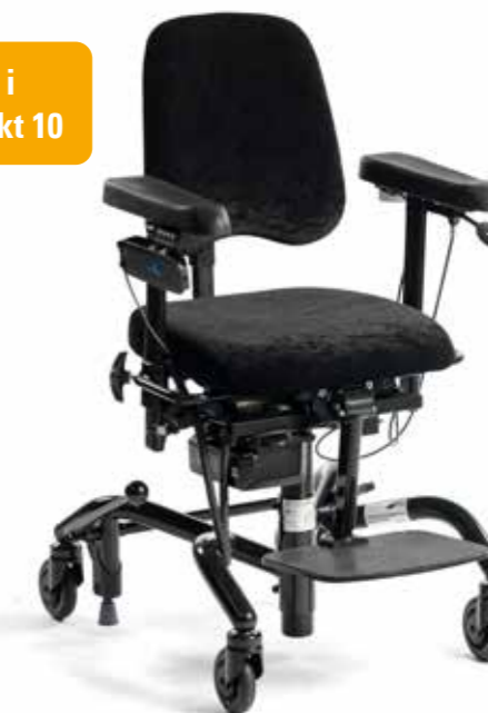
Real 9400 plus EI 24V (aktiv) standard utførelse