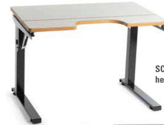
SCRIBA manuell, hel bordplate