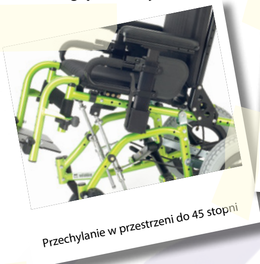
Przechyłanie w przestrzeni do 45 stopni