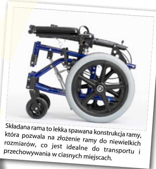
Składana rama to lekka spawana konstrukcja ramy, która pozwala na złożenie ramy do niewielkich rozmiarów, co jest idealne do transportu i przechowywania w ciasnych miejscach.

Zippie TS ma wbudowaną możliwość rozbudowy ramy z najszerszą gamą opcji i jest w stanie przyjąć wiele rozwiązań w zakresie siedzenia i pozycjonowania.