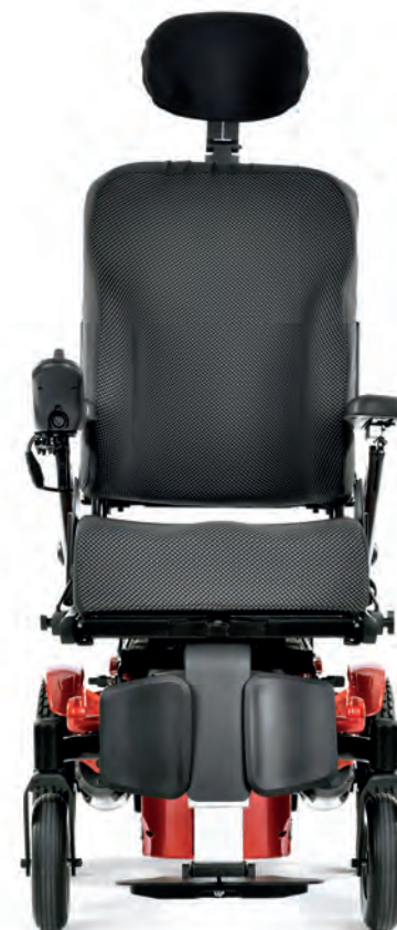
Q300 R MINI