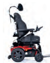
Q300 R Mini