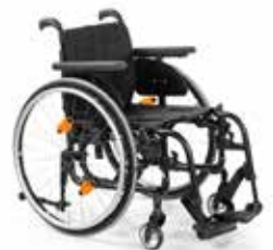
QS5 X DK4

Aktiv rullestol med sammenleggbar ramme med fast benstøtte,