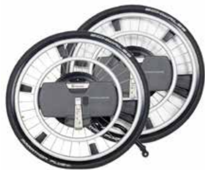
Empulse WheelDrive Drivhjul med elektrisk motor.

Les mer om drivaggregater på vår hjemmeside www.SunriseMedical.no eller i vår katalog Manuelle rullestoler og drivaggregater.