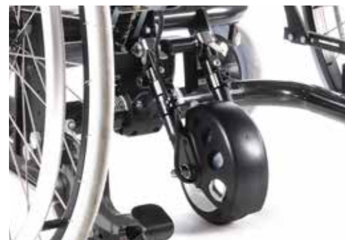
Empulse R20 ledsagerstyrt drivaggregat.