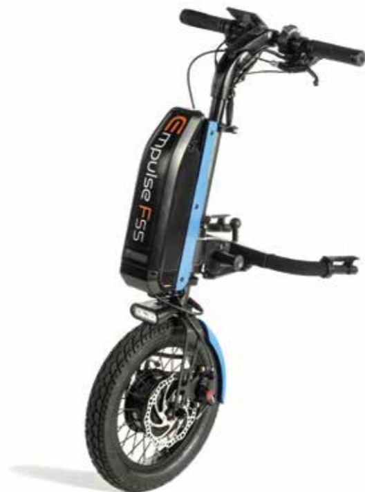
Empulse F55 Drivaggregat med manuell styring.