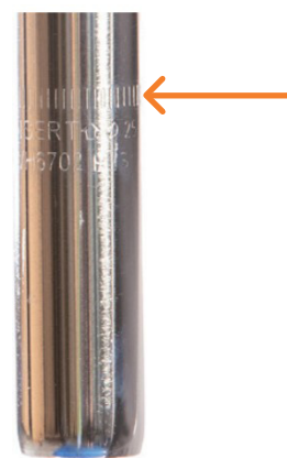
Figur 3: Høydemerking