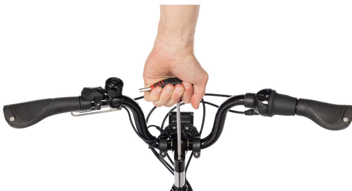
Figur 4: Løsne bolten med en umbrakonøkkel

Merk: Sikkerhetsmerkingen på styret må ikke være synlig når styret er i styrerøret (Figur 5).