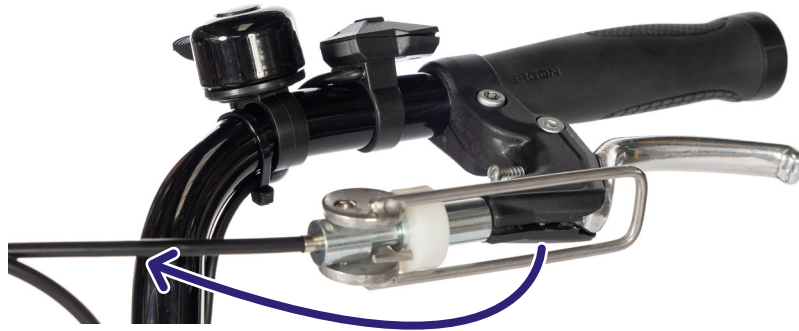
Figur 1: Du kan (de-)aktivere parkeringsbremsen ved å bevege denne spaken.

Så snart parkeringsbremsen treffer bremsehendelen, aktiveres bremsen (figur 1).