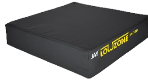
横3本 面ファスナー