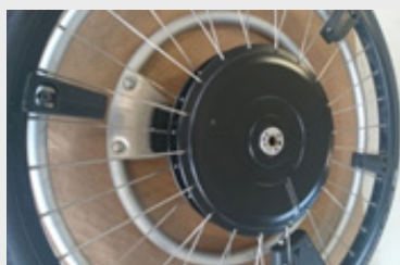
WheelDrive sans platine de l'anti-basculé

Plus vous décrivez précisément le défaut, plus vite nous pouvons réagir et effectuer la réparation. Une photo ou une vidéo de l'erreur est également très utile.