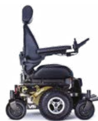
VERT MILITAIRE - JANTES CHROMÉES

«NOUS CRÉONS DES FAUTEUILS ROULANTS SUR MESURE DEPUIS 25 ANS POUR QUE VOUS PUISSIEZ VIVRE VOTRE VIE»