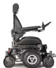
NOIR - JANTES CHROMÉES