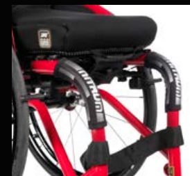
Protection de châssis design