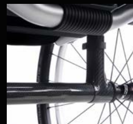
Assemblage de l'essieu avec sup- Frein compact léger EVO port et tube d'axe en carbone