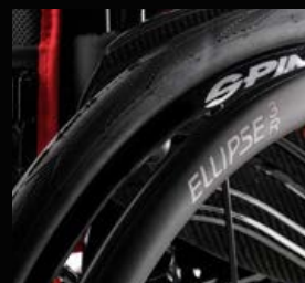
Main courante Ellipse 3R