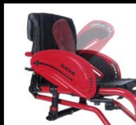
Mécanisme de pivotement pour partie latérale en aluminium : transfert facilité, encombrement réduit