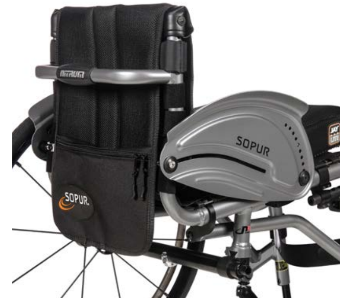
Nitrum Hybrid Pro