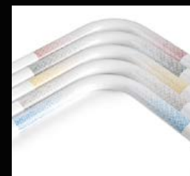
Décor de châssis «Floating Dots»

Utilisez notre visualisation 3D pour créer le SOPUR Nitrum de vos rêves !