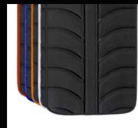
Toile de dossier EXO Evo ou EXO Pro Evo disponible en 5 couleurs