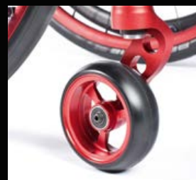
Fourche de roue directrice monobras en aluminium et roue directrice avec jante alu, disponible en 5 couleurs anodisées