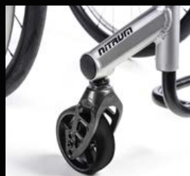
Fourche des roues avants Carbotecture®