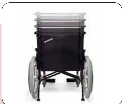
Dossier adaptable en hauteur pour confort optimal