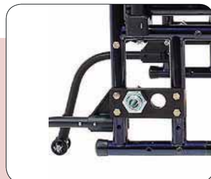
Centre de gravité réglable pour accroître la sécurité