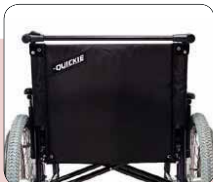
Barre de stabilisation pour renforcer le dossier