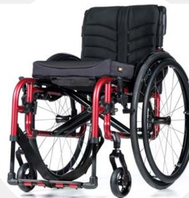
Châssis avec repose-pieds pivotable et amovible (FA)