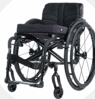
Châssis avant fixe (FF)

La variante avec repose-pieds pivotable et amovible (SA) permet un transfert simple et confortable. Si l'on enlève le repose-pieds, distance de transfert et encombrement sont réduits en conséquence.