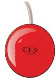
// QML110651 - QML110655