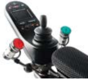
// QEP110560 - QEP110098