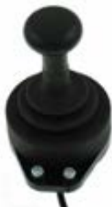
// QEP110308 - QEP110311