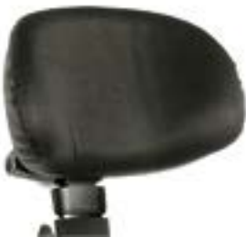
// QEP030430 & QEP030431