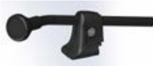
// QEP110534 - QEP110536 // QEP110095 - QEP110097