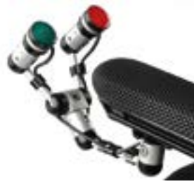
// QEP110566 - QEP110099