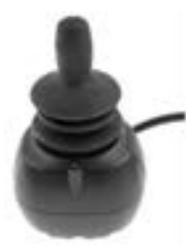
// QEP110306 - QEP110309