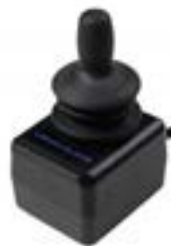
// QEP110304 // QEP110305