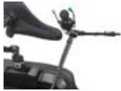
// QEP110565 - QEP110105