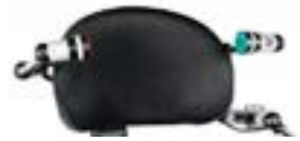
// QEP110561 - QEP110100