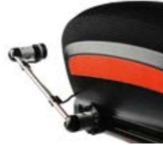
// QEP110563 - QEP110104