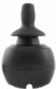
// QEP110307 - QEP110310