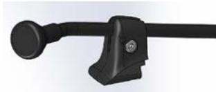
Pulsador Twister // QMP110534 - QMP110536