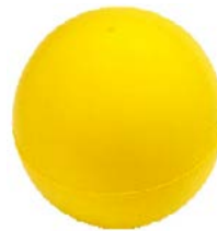
Bola blanda para el joystick // QMP090507