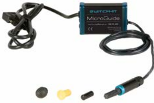
Switch It Micro Guide // QMP110470 // QMP110301