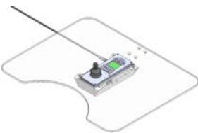
Mando con pantalla a color LCD montado en el centro de mesa // QMP110143