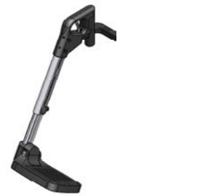
Reposapiés Sedeo Pro a 70° // QML050015