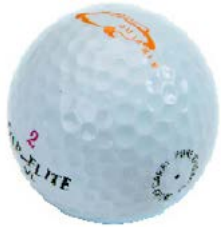
Bola de golf para joystick // QMP090505