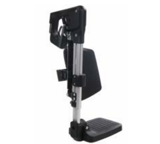
Elevables manualmente // QMP050016