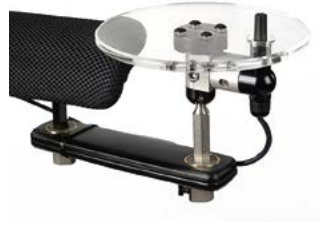
Switch It MicroPilot con sistema de montaje LINK-IT en disco // QMP110353 // QMP110302 // QMP110362 // QMP110342