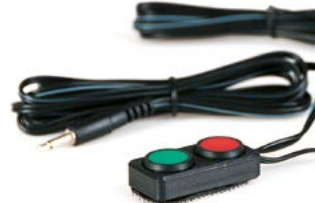
Bandeja con 2 pulsadores // QMP110551