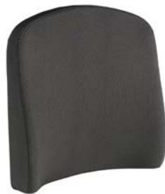
Respaldo SEDEO PRO con cinchas // QMP030113