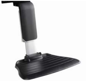
Reposapiés centrales // QMP050086