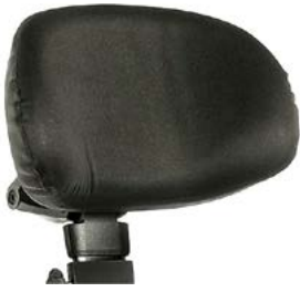
Reposacabezas anatómico SEDEO // QMP030430 - QMP030431