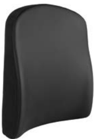
Respaldo SEDEO PRO // QMP030109