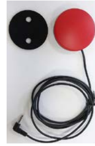
Botón pulsador 64 mm // QMP110611 - QMP110613 // QMP110631 - QMP110633