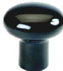
Pomo de joystick en forma de seta // QMP090511