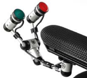
2 pulsadores con sistema de montaje LINK-IT al reposabrazos // QMP110566 // QMP110526 // QMP110529