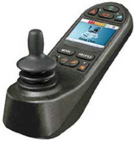
Mando R-Net con pantalla a color // QMP110017