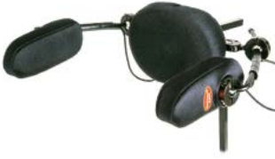
Mando pulsador de cabeza Dual Pro Switch It // QMP110370 // QMP110371