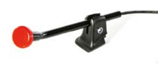
Pulsador Satellite // QMP110537 - QMP110539