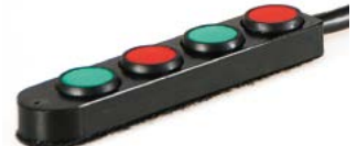
Bandeja con 4 pulsadores // QMP110552