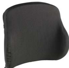
Respaldo SEDEO PRO Active Flexible Contorno muy Profundo // QMP030117