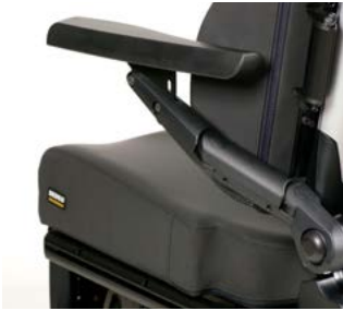
Reposabrazos reclinables articulados // QMP040070