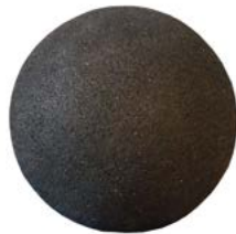
Media bola Allround // QMP090045