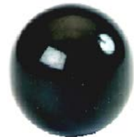
Bola de joystick // QMP090508