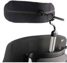
Brazo de montaje AXYS para reposacabezas Whitmyer // WHT030409