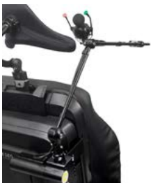
Allround Joystick en brazo abatible eléctrico // QMP110485 // QMP110474