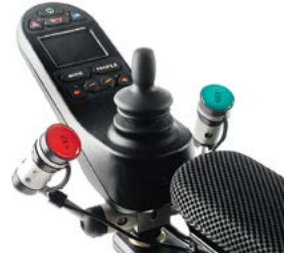
2 pulsadores con sistema de montaje LINK-IT al mando de control // QMP110560 // QMP110572 // QMP110013 // QMP110056 // QMP110529 // QMP110526