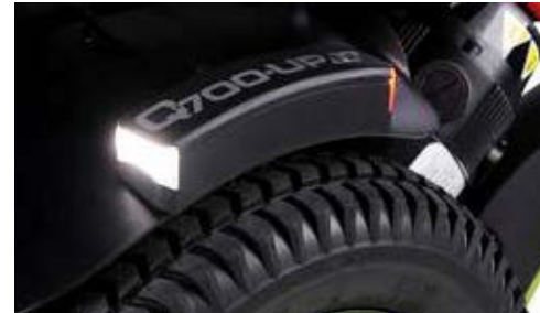
Luces en guardabarros // QMP110202