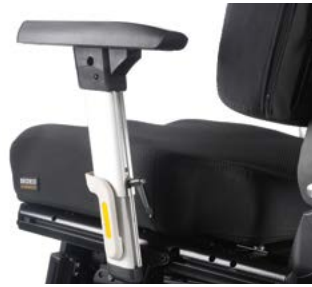
Reposabrazos desmontables // QMP040021