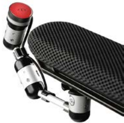
Pulsador con sistema de montaje LINK-IT al reposabrazos // QMP110526 // QMP110566