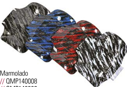
Marmolado // QMP140008 // QMP140009 // QMP140010 // QMP140011