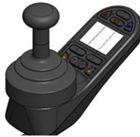
Mando R-Net con pantalla a color Heavy Duty // QMP110018