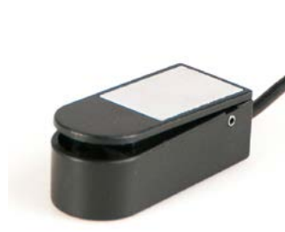
Micro Lite // QMP110524