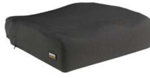
Cojín SEDEO PRO con soporte y memoria // QMP020076