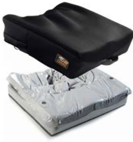
Jay 2 Profundo

NOTA: Consulta el catálogo de Jay para ver todos los modelos de cojines disponible.