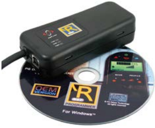
R-Net PC Programmer // QMP090066