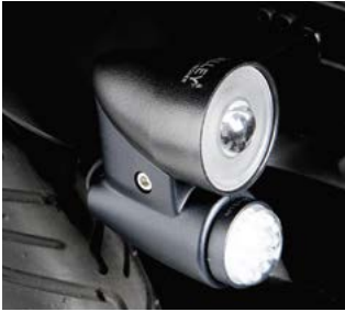
Luces e Indicadores de LEDs // QMP110201