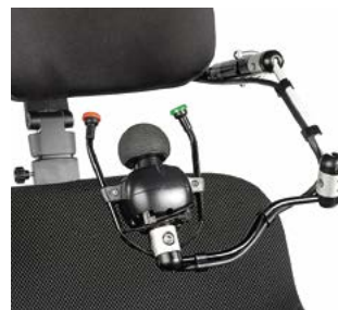
Allround Joystick con sistema de montaje LINK-IT al reposacabezas // QMP110487 // QMP110474