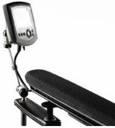
Pantalla Omni con sistema de montaje LINK-IT al brazo abatible del mando // QMP110353 // QMP110302 // QMP110362