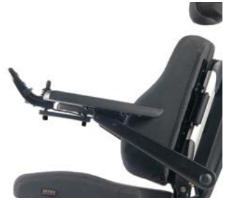
Reposabrazos reclinables // QMP040123