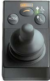
Mando R-Net para usuario y acompañante // QMP110021