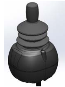
Allround Joystick // QMP110306 - QMP110309 // QMP110474 - QMP110477