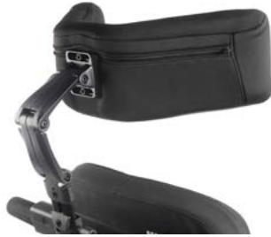
Reposacabezas flexible SEDEO // QMP030432