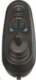
Mando VR2 para 2 actuadores // QMP110037