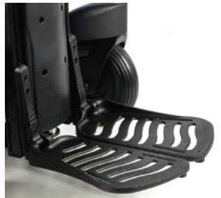
Reposapiés central elevable eléctrico // QMP050076