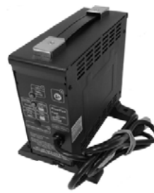
Cargador de 220 V / 8 A // QMP160101