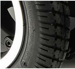
Ruedas de 13" macizas "Knobbly" // QMP070069