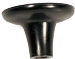
Pomo de joystick para mentón // QMP090509