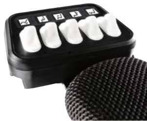
Caja ctrl+5 con interruptores // QMP110176