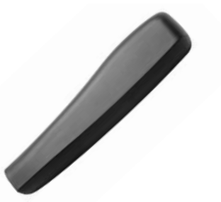
Almohadillado 30 cm // QMP040023