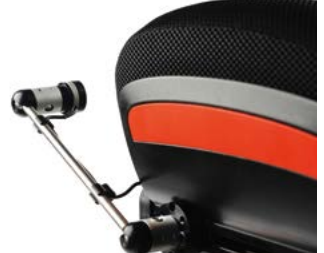
Pulsador montado en los railes del asiento // QMP110563