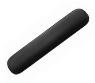
Almohadillado Comfort Skai // QMP040204