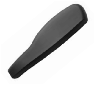
Almohadillado ancho 45 cm // QMP040027