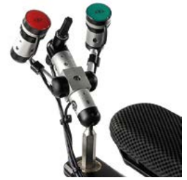
Micro Lite y pulsadores con sistema de montaje LINK-IT al mando de control // QMP110353 // QMP110361 // QMP110524 // QMP110526 // QMP110560