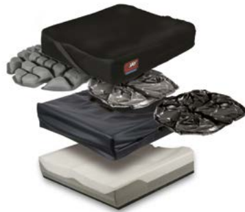
Jay Balance con aire, fluido JAY o fluido CRYO