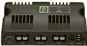
Caja de control R-Net 120A // QMP110004