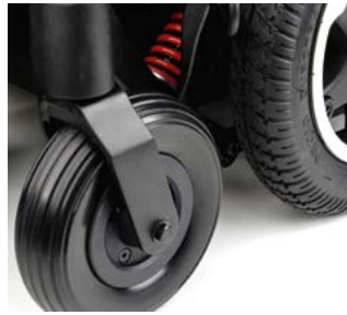
Ruedas macizas de 7", color negro // QMP080213