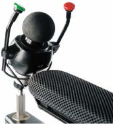
Allround Joystick con 2 pulsadores Satellite y sistema de montaje LINK-IT al mando de control // QMP110353 // QMP110306 // QMP110362 // QMP110538 // QMP110539