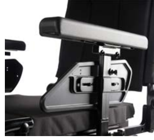
Reposabrazos en forma de T, SEDEO LITE // QMP040022