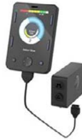
Pantalla Omni2 // QMP110116