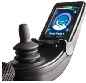
Mando Advanced // QMP110013