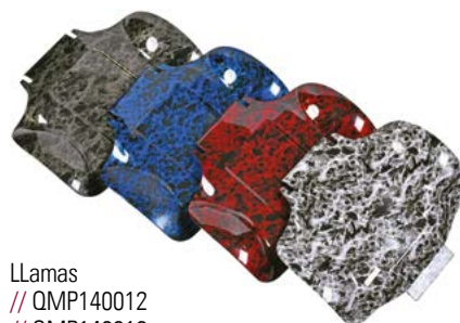
Llamas // QMP140012 // QMP140013 // QMP140014 // QMP140015