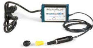
Switch It Micro Pilot // QMP110471 // QMP110302