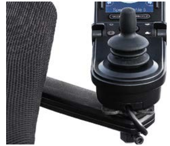
Mecanismo encapsulado para abatir el mando // QMP110056