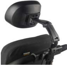
Brazo de montaje multiposición SEDEO // QMP030433