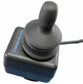
Switch It VersaGuide // QMP110472 // QMP110473 // QMP110304 // QMP110305