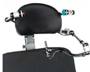
Switch It Micro Pilot y 2 pulsadores con sistema de montaje LINK-IT al reposacabezas // QMP110487 // QMP110471 // QMP110526 // QMP110529 // QMP110561 // QMP110572 // QMP110571