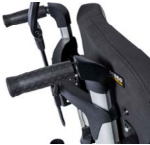
Empuñaduras ajustables en altura // QMP030204