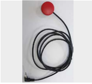
Botón pulsador 30 mm // QMP110651 - QMP110655 // QMP110671 - QMP110675