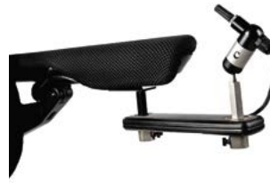
Switch It Micro Pilot // QMP110302