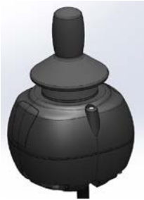
Allround Joystick Light // QMP110475 // QMP110477 // QMP110307 // QMP110310