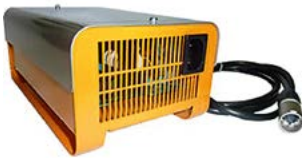
Cargador de 220 V / 8 A, con grado de protección IP54 // QMP160102