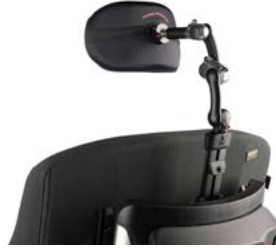
Brazo de montaje LINX2 para reposacabezas Whitmyer // WHT030408