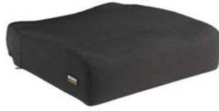
Cojín SEDEO PRO con soporte // QMP020075