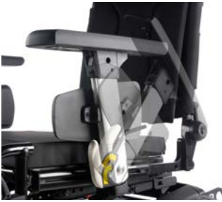
Reposabrazos abatibles // QMP040019