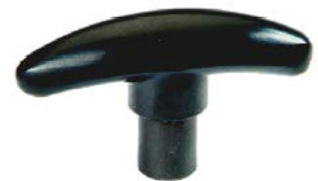
Joystick en forma de T // QMP090506