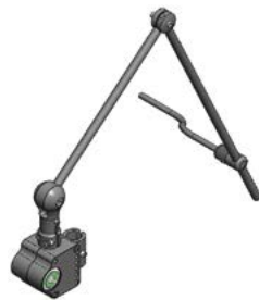
Brazo abatible manual para mentoniano // QMP110483 // QMP110484