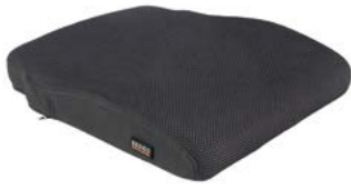
Cojín SEDEO PRO acolchado // QMP020073