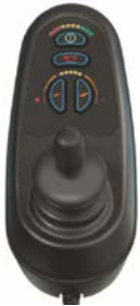
Mando VR2 // QMP110036