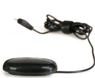
Pulsador ovalado // QMP110523