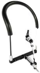
Arnés para mentoniano // QMP110480 // QMP110470 // QMP110471