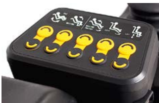
Caja de control ctrl+5 con botones // QMP110175