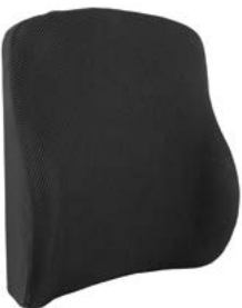
Respaldo SEDEO PRO Active Flexible // QMP030116