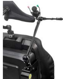
Brazo abatible eléctrico para mentoniano // QMP110485 // QMP110486