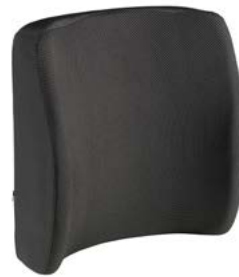
Respaldo SEDEO PRO Passive // QMP030114