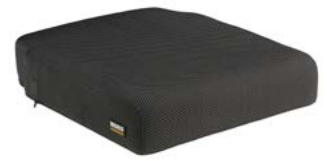
Cojín SEDEO PRO con estabilidad // QMP020078