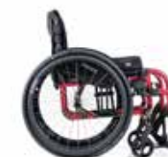
Quickie QS5 X Potences Escamotables