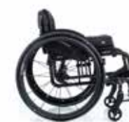
Quickie QS5 X Potences Fixes