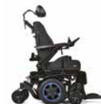
Q300 M Mini

To jest wyrób medyczny. Używaj go zgodnie z instrukcją używania lub etykietą.