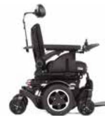
Q300 M Mini Teens

To jest wyrób medyczny. Używaj go zgodnie z instrukcją używania lub etykietą.