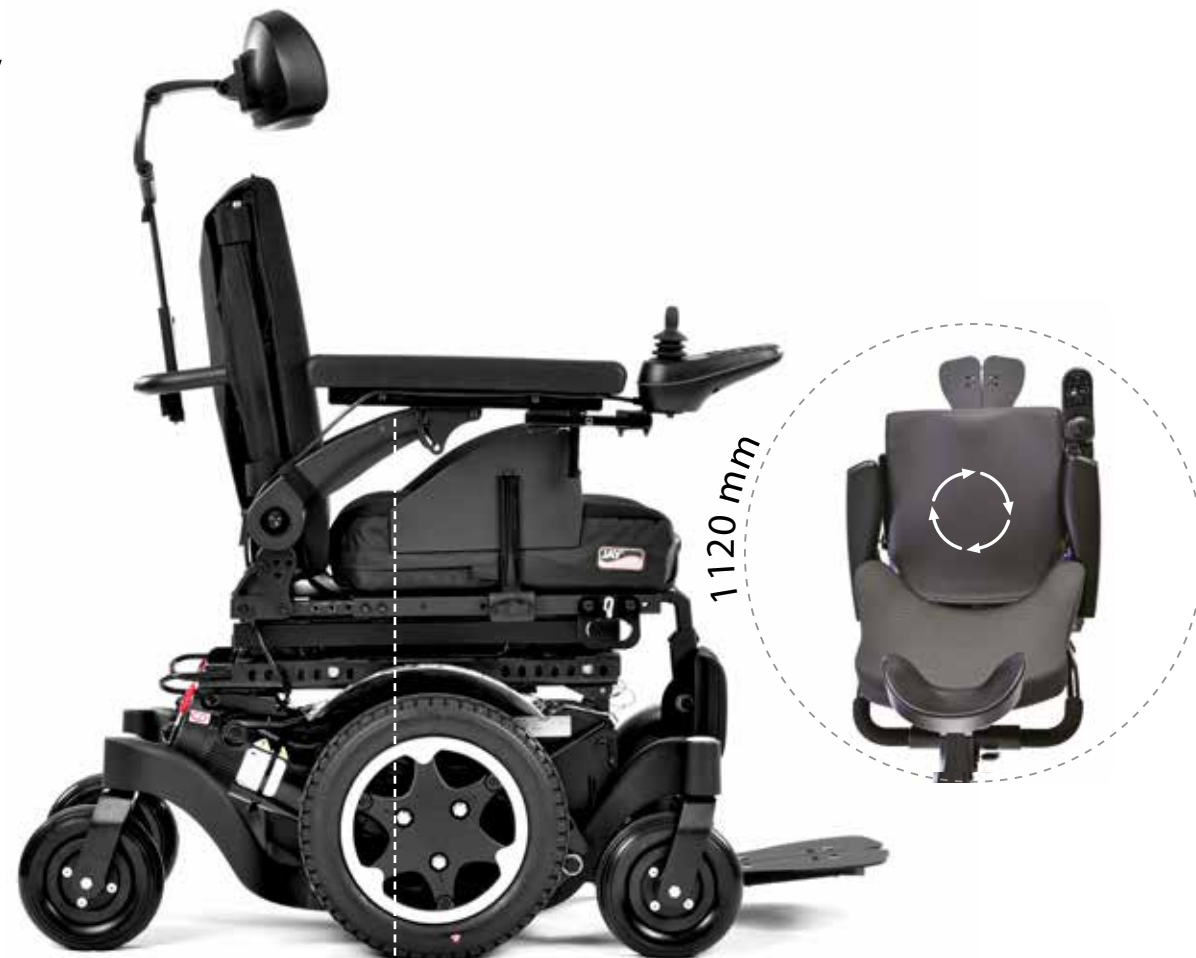
Technologia napędu na środkowe koła

Niezależne amortyzowane zawieszenie wszystkich kół Nasze OPATENTOWANE niezależne amortyzowane zawieszenie wszystkich kół zapewnia, że wszystkie sześć kół pozostaje na ziemi podczas pokonywania przeszkód. Wszelkie wstrząsy i uderzenia są pochłaniane przez zawieszenie kół, zapewniając miękką i płynną jazdę.