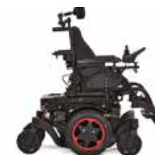
Q300 M Mini Kids

To jest wyrób medyczny. Używaj go zgodnie z instrukcją używania lub etykietą.