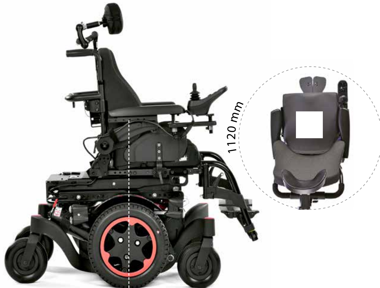
Technologia napędu na środkowe koła

Szukasz najbardziej kompaktowej podstawy do manewrowania w pomieszczeniach? Wybierz 12-calowe koła napędowe, jeśli wolisz lepsze osiągi w terenie? Wybierz 14"!