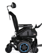
Q300 M Mini SEDEO LITE