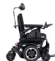
Q300 M Mini Teens