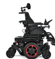
Q300 M Mini Kids