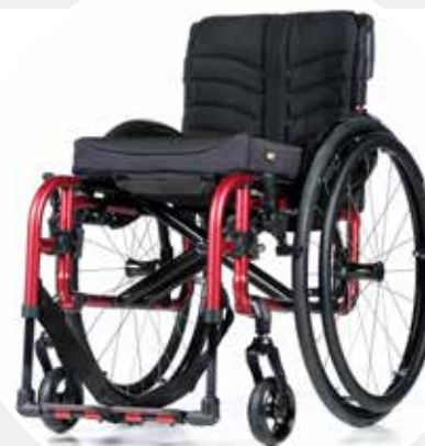
Rahmen mit abschwenk- und abnehmbarer Fußraste