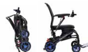
Q50 R Carbon

Cadeira de rodas encartável com bateria de lítio.