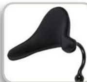
コントウア クレードル