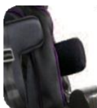
ラテラル体幹サポート