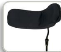
アジャスト ブラッシュ