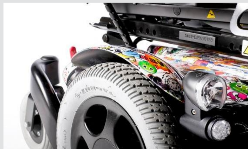
車いすフレーム設計用ホイール (箔)

それだけではありません。B4M特注部門は、これまで何千台ものオーダーメイド電動車いすを制作してきました。型にはまらない、オンリーワンの電動車いすを作るお手伝いをします。