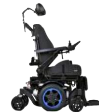
Q300 M ミ