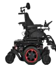
Q300 M ミキズ