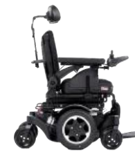
Q300 M ミティーンズ