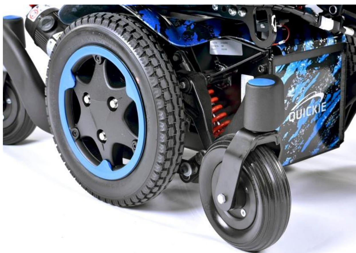
Q300 M ミニ キッズ