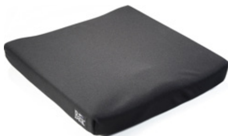
失禁対策用カバー