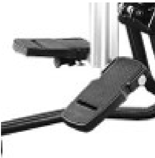
// 117-1776 Fußstützen, geteilt, höhenverstellbar, Fuß- und Kniewinkel einstellbar (Paar)