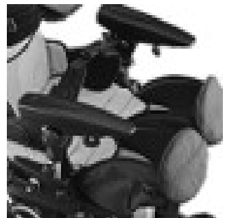
// 117-765-05VIN Kniepolster, schwarz (Paar)