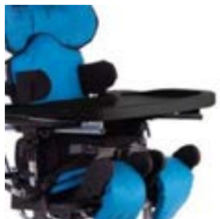
// 117-646 Therapietisch, schwarz (Nur in Verbindung mit Armlehnen)