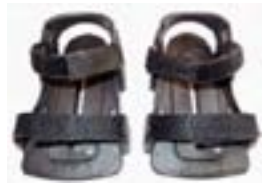
// 152-1600 Fußschalen inkl. Fußgurte (Paar)