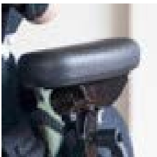
// 117-1777 Armlehnen mit Tischaufnahme, höhen- und winkelverstellbar (Paar)