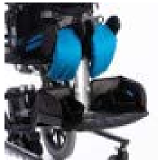
// 117-3776 Durchgehender Fußkasten, gepolstert