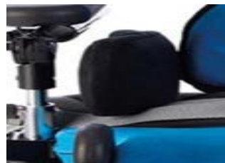
// 117-642-05 Beckenpelotten mit Bezug