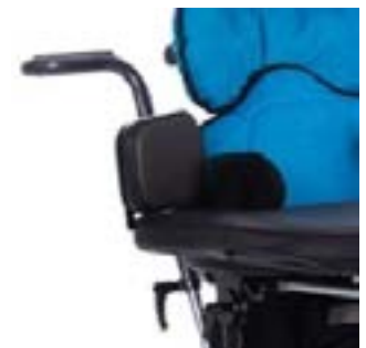
// 117-641 Ellenbogenpolster für Tisch