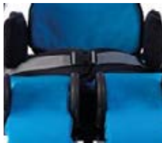
// 117-476 Beckenfixierung umgreifend, schwarz