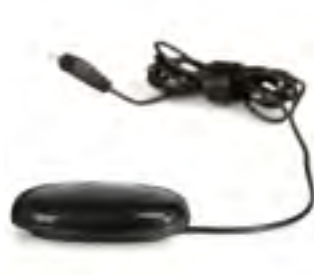
// QPL110523 #1 エッグスイッチ-ブラック