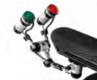
// QPL110566 // QPL110526 // QPL110529