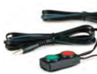
// QPL110551 ミニ 2 ボタン (デュアルモード・プラグ)