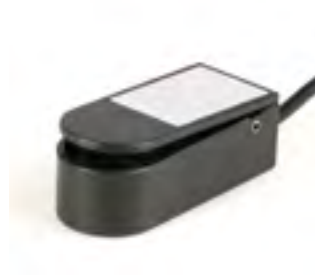
// QPL110524 #1 マイクロライト・スイッチ-ブラック