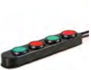
// QPL110552 ミニ 4 ボタン InLine (DB9コネクター)