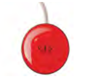
// QPL110526 ~ QPL110530 ピコ・ボタン (ブラック, ブルー, グリーン, レッド, イエロー)