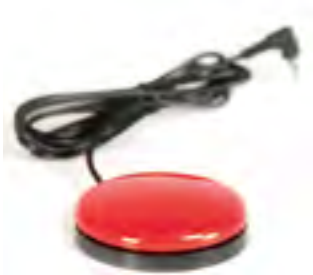
// QPL110521 #1 パディボタン-レッド