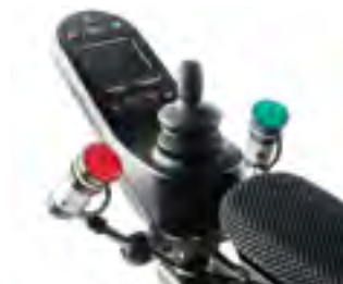
// QPL110560 // QPL110572 // QPL110013 // QPL110056 // QPL110529 // QPL110526