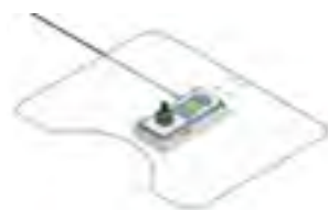
Table Top Controls テーブルトップ・コントロール

// QPL110475 // QPL110477 // QPL110307 // QPL110310