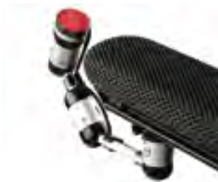
// QPL110526 // QPL110566