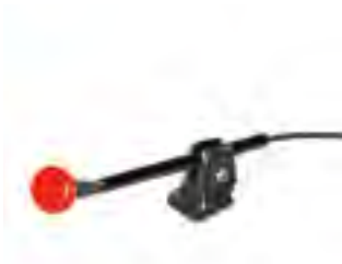
// QPL110537 ~ QPP110539 #1 サテライト・スイッチ (ブラック, グリーン, レッド)