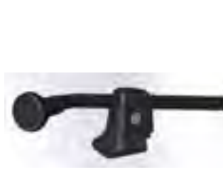
// QPL110534 ~ QPL110536 ツイスタースイッチ (ブラック, グリーン, レッド)