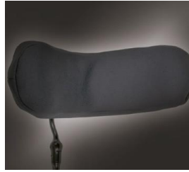
// WHT030404 & WHT030406