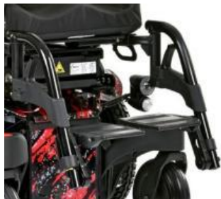
// QZK050001 // QZK050050 // QZK050167