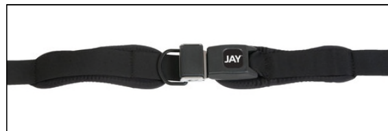
2-ポイントパッド付押しボタン