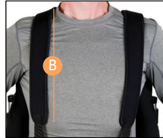
バックパックスタイル