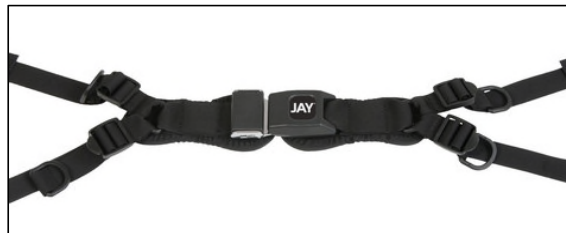
4-ポイントパッド付押しボタン