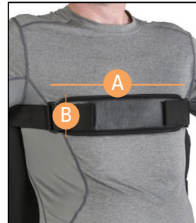
パッド付体幹ストラップ