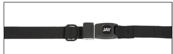
2-ポイントパッドなし押しボタン