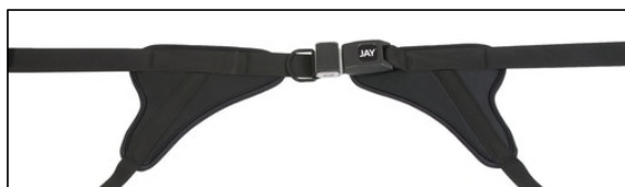
V-コントゥアパッド付押しボタン