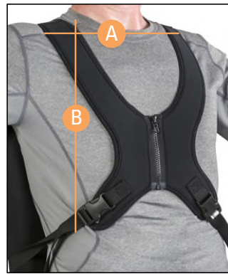
ジッパー付きセンターオープンスタイル