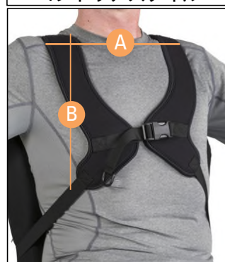
コントゥアスタイル