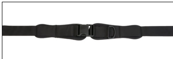
2-ポイントパッド付サイドリリース