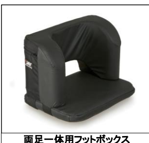
両足一体用フットボックス