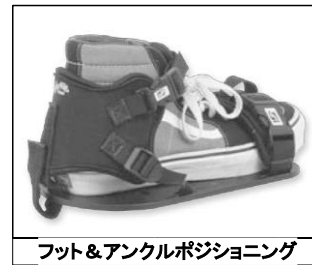
フット&アングルポジショニング