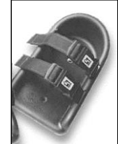
シューズホルダー