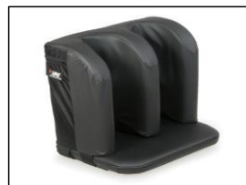
両足 セパレートフットボックス