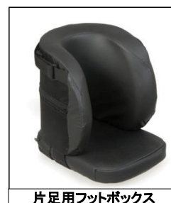
片足用フットボックス