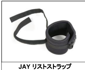
JAY リストストラップ