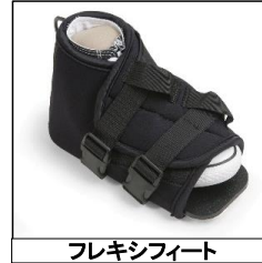
フレキシフィート