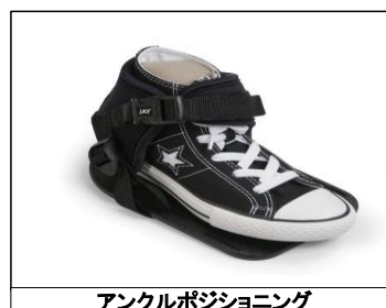
アンクルポジショニング