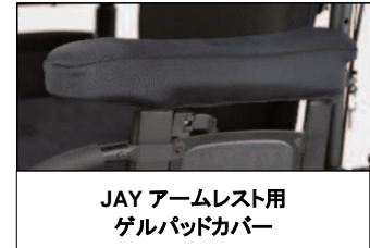
JAY アームレスト用 ゲルパッドカバー