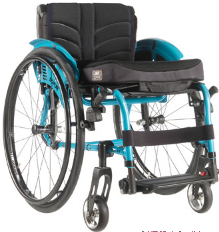
→ LIFE RT – le Sportliche