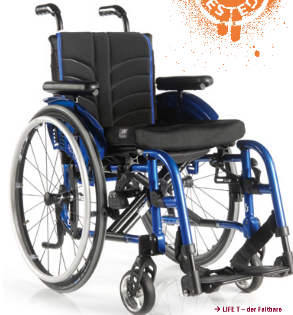
→ LIFE T – der Faltbare