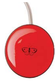
// QML110651 - QML110655