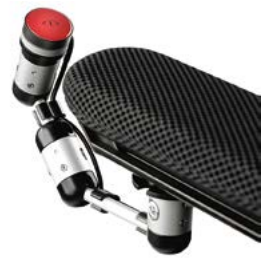
// QML110651 // QML110566