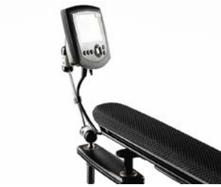
// QML110353 // QML110302 // QML110362