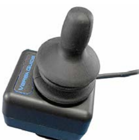
// QML110472 - QML110473 // QML110304 - QML110305