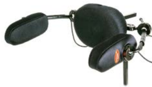
// QML110370 - QML110371