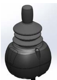
// QML110306 - QML110308 // QML110474 - QML110475