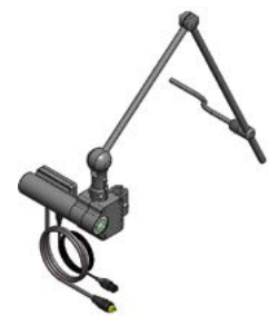
// QML110485 - QML110486