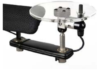
// QML110353 // QML110302 // QML110362 // QML110342