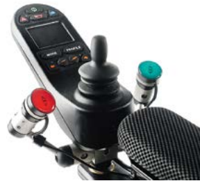
// QML110560 // QML110572 // QML110013 // QML110056 // QML110652 // QML110651