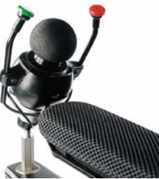
// QML110353 // QML110306 // QML110362 // QML110538 // QML110539