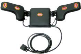
// QML110401 - QML110406