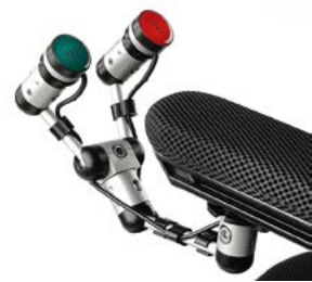
// QML110566 // QML110651 // QML110652