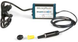
// QML110471 // QML110302