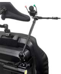
// QML110485 // QML110474