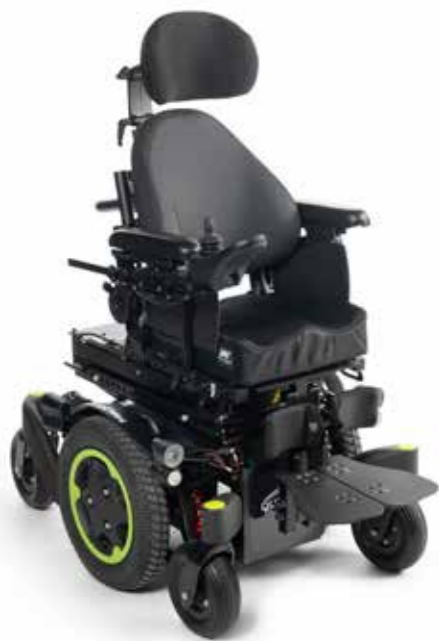
Q300 M Mini kids- Delkontrakt 21

Delkontrakt 28- Motorisert styring for innendørs bruk med elektrisk tilt og ryggvinkling - for barn, 3. valg.