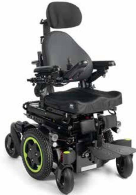
Q300 M Mini kids- Delkontrakt 28