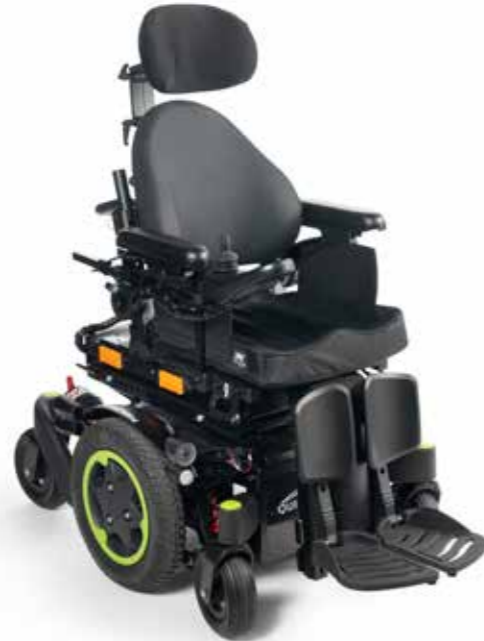
Q300 M Mini kids- Delkontrakt 22