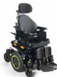
Q300M Mini kids DK 22