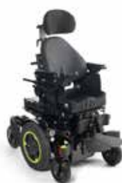
Q300M Mini kids DK 21

Elektrisk rullestol med motorisert styring for begrenset utendørs bruk med midthjulsdrift