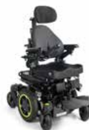
Q300M Mini kids DK 28