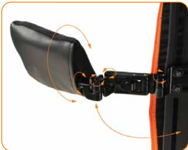
JAY UTSVINGBARE SIDESTØTTER MED ROTASJON Ekstra justering for støtte av trunkus.