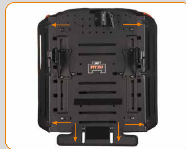
Høyde og bredde Justerbar Bredde og høyde kan justeres fem centimeter, uavhengig av hverandre, for å kunne tilpasses skiftende stillinger og en person i vekst.