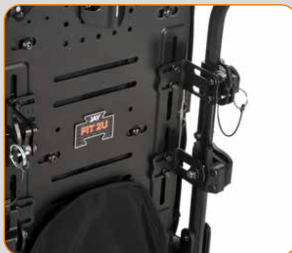
Fire-Punkts System (FP) Patenterte JAY J3-braketter med hurtigutløser gjør det mulig å enkelt løsne ryggen fra rullestolen. To-punkts braketter er også tilgjengelig.

ZIPPIE IRIS® med JAY FIT 2U™ BACK og JAY GS® sittepute