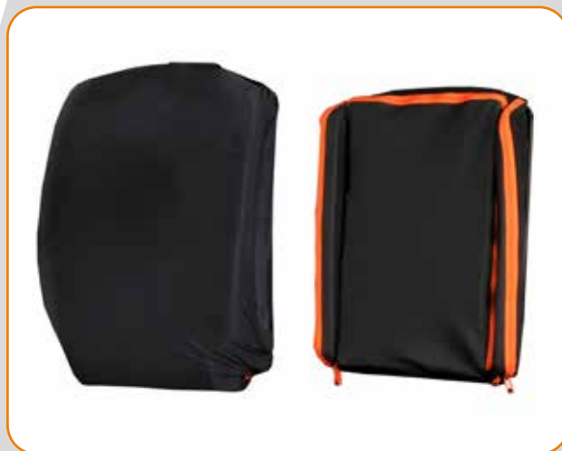
Dual-trekk System Det ytterste trekket kan enkelt fjernes for rengjøring mens innertrekket holder innlegg tørre og på plass.