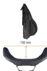
Mid Deep Contour