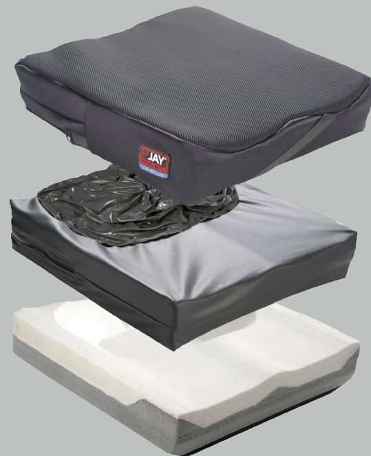
JAY Balance s Cryo Fluid