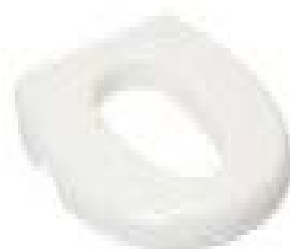
// 10047 Toilettenverkleinerer mittel