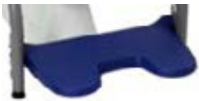
// 10039 Fußplatte hochklappbar und höhenverstellbar