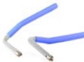
// 10084 Zusätzliche Armlehnen mini, gekröpft