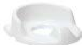
// 10049 Toilettenverkleinerer mit hohen Seiten