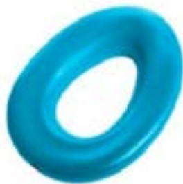
// 74020004 Toilettenverkleinerer mit Komfortpolster