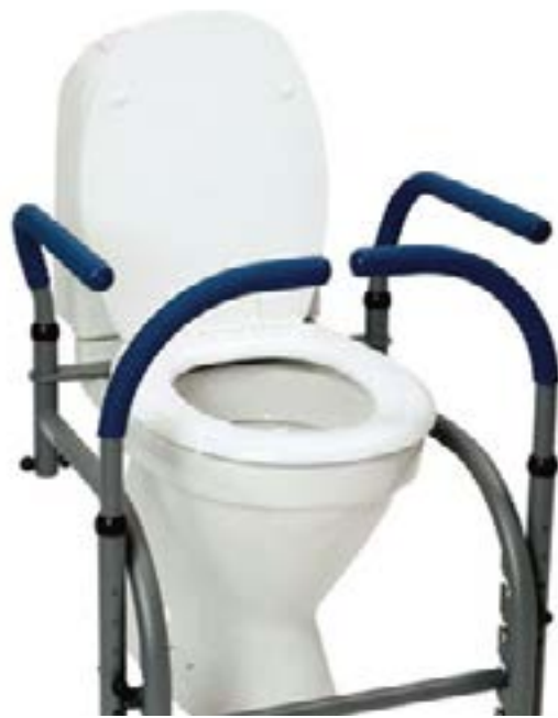
// 10106 Balance Model 6, Armlehne gebogen