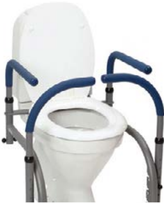
// 10103 Balance Model 3, Armlehne gerade