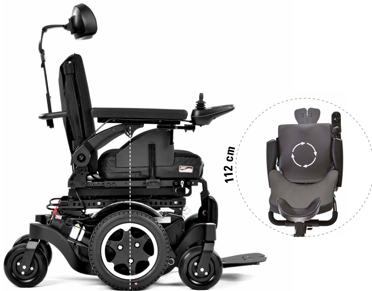
Tecnología de Tracción Central

¿Buscas la base más compacta posible para una gran maniobrabilidad en espacios cerrados? Las ruedas motrices de 12" son perfectas. Si, por el contrario, prefieres un alto rendimiento al aire libre, elige las ruedas de 14".