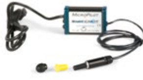
(2) Joystick MicroPilot