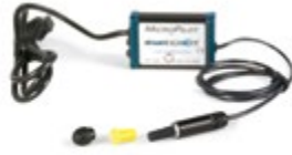
(2) Joystick MicroPilot