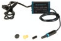
(1) Joystick MicroGuide