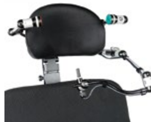
// QPL110487 // QPL110471 // QPL110526 // QPL110529 // QPL110561 // QPL110572 // QPL110571