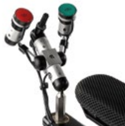
// QPL110353 // QPL110361 // QPL110524 // QPL110526 // QPL110560