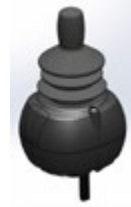
(3) Joystick Allround