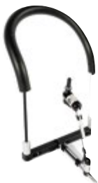
(1) Pettorina con sistema Link-It