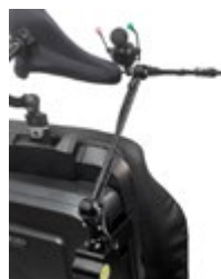
(2) Braccetto retraibile manualmente, montaggio posteriore allo schienale