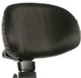
// QPL030430 & QPL030431