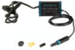
(1) Joystick MicroGuide