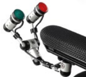
// QPL110566 // QPL110526 // QPL110529