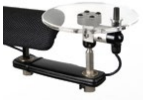
Montaggio Space Disk Link-it