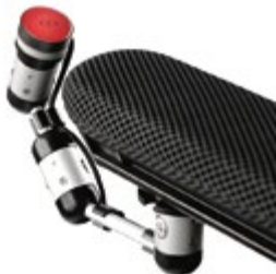
// QPL110526 // QPL110566