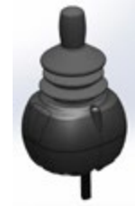
(3) Joystick Allround