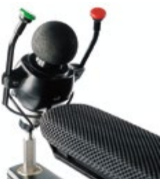
// QPL110353 // QPL110306 // QPL110362 // QPL110538 // QPL110539