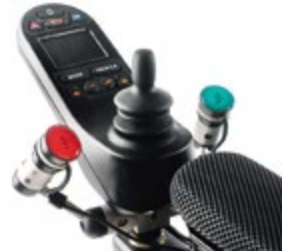
// QPL110560 // QPL110572 // QPL110013 // QPL110056 // QPL110529 // QPL110526