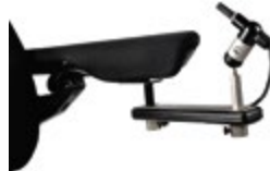
Montaggio al bracciolo swing away