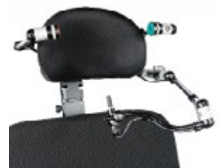
(4) Sistema di fissaggio Link-It applicato direttamente all'appoggiatesta