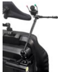
(3) Braccetto retraibile elettronicamente, montaggio posteriore allo schienale