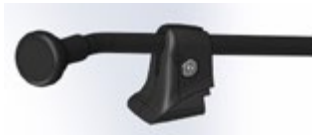
// QPL110534 - QPL110536