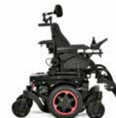
Q300 M Mini Kids