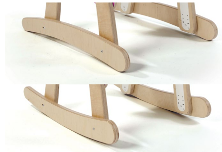
Base Stabilisatrice / Oscillante