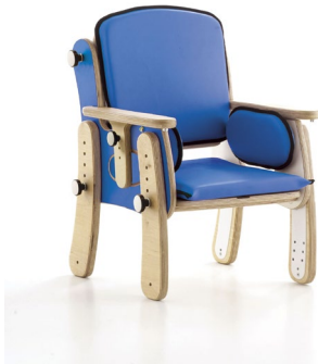
Base avec pieds