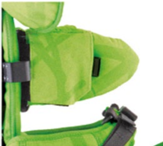
Cales tronc escamotables