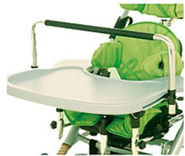
Barre d'activité pour tablette