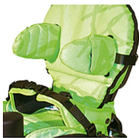
Rembourrage supplémentaire de dossier