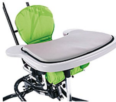
Coussin pour tablette