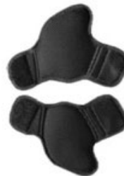
Rembourrage ceinture pelvienne