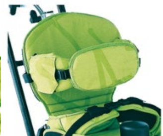
Support sternal antérieur