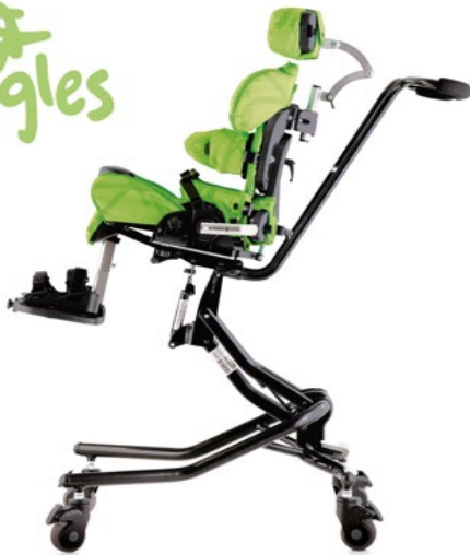
Châssis Hi-Low avec poignée de poussée