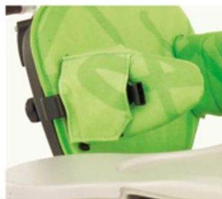
Cales tronc fixes