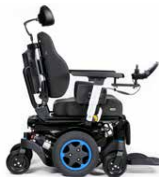
Q300 M Mini

EEN COMPLETE SERIE ELEKTRISCHE ROLSTOELN - DEKT ALLE SEGMENTEN - VAN BASIS MOBILITEIT TOT COMPLEXE KLINISCHE BEHOEFTE - ZONDER COMPROMISSEN.