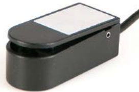
Micro Lite // QML110524