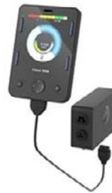
Pantalla Omni2 // QML110116