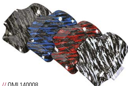
// QML140008 // QML140009 // QML140010 // QML140011