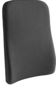
Respaldo SEDEO LITE, con cinchas // QML030131