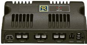
Caja de control R-Net 120A // QML110004