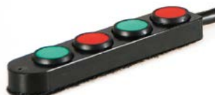
Bandeja con 4 pulsadores // QML110552