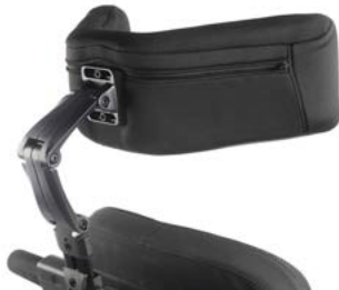
Reposacabezas flexible SEDEO // QML030432