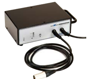
Cargador de 220 V / 10 A // QML160104