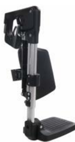
Sedeo Pro elevables manualmente // QML050016