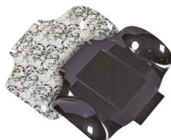
// QML140016 // QML140017