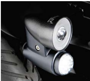
Luces de LED's // QML110201