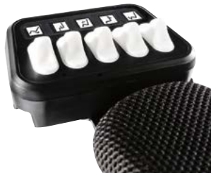
Caja ctrl+5 con interruptores // QML110176