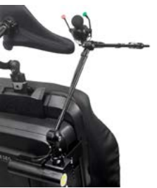
Allround Joystick en brazo abatible eléctrico // QML110485 // QML110474