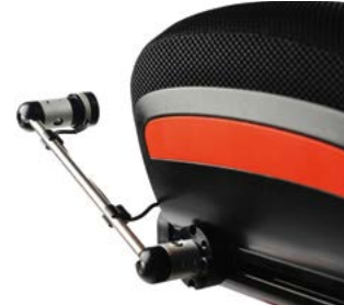
Pulsador montado en los railes del asiento // QML110563