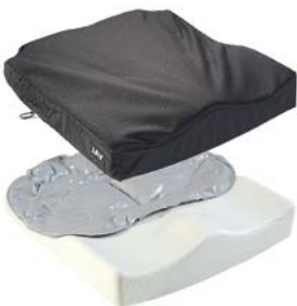
Jay Easy Fluid