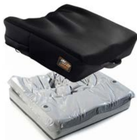
Jay 2 Profundo

NOTA: Consulta el catálogo de Jay para ver todos los modelos de cojines disponible.