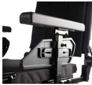
Reposabrazos en forma de T, SEDEO LITE // QML040022