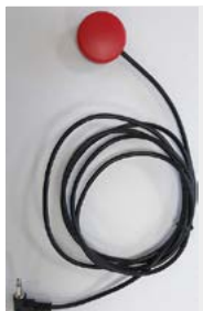
Botón pulsador 30 mm // QML110651 - QML110655 // QML110671 - QML110675