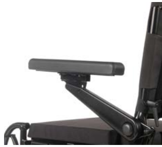
Reposabrazos reclinables // QML040123