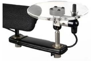
Switch It MicroPilot con sistema de montaje LINK-IT en disco // QML110353 // QML110302 // QML110362 // QML110342