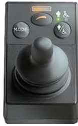
Mando R-Net para usuario y acompañante // QML110021