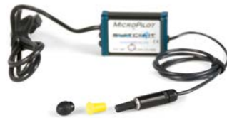
Switch It Micro Pilot // QML110471 // QML110302