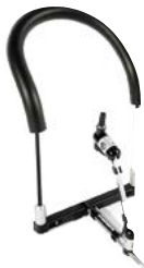
Arnés para mentoniano // QML110480 // QML110481 // QML110470 // QML110471