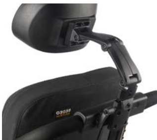
Brazo de montaje multiposición SEDEO // QML030433