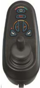
Mando VR2 para 2 actuadores // QML110037