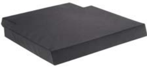
Cojín standard // QML020098