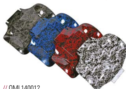
// QML140012 // QML140013 // QML140014 // QML140015