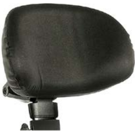
Reposacabezas anatómico SEDEO // QML030430 & QML030431