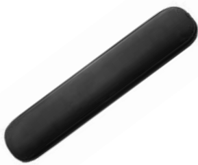
Almohadillado Comfort // QML040204