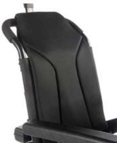
Tapicería de respaldo ajustable en tensión // QML030150