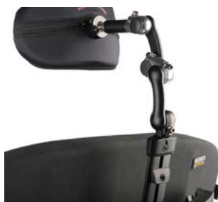
Brazo de montaje LINX 2 para reposacabezas Whitmyer // WHT030408