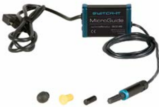
Switch It Micro Guide // QML110470 // QML110301