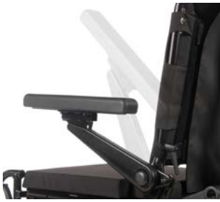
Reposabrazos abatibles // QML040039