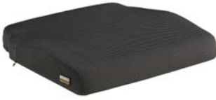
Cojín SEDEO acolchado // QML020073