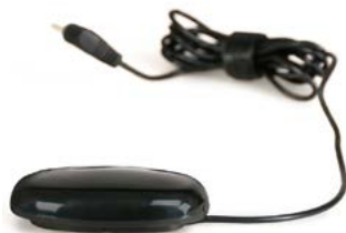
Pulsador ovalado // QML110523