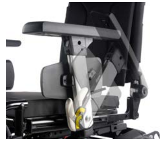
Reposabrazos en forma de T, abatibles // QML040019