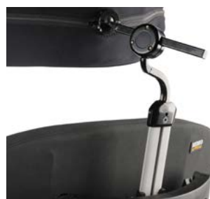
Brazo de montaje AXYS para reposacabezas Whitmyer // WHT030409