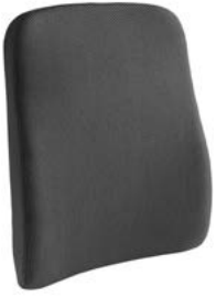
Respaldo SEDEO LITE // QML030130