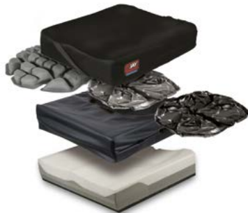
Jay Balance con aire, fluido JAY o fluido CRYO