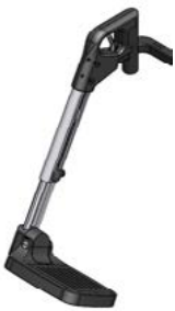
Reposapiés Sedeo Pro a 70° // QML050015