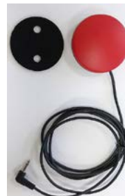
Botón pulsador 64 mm // QML110611 - QML110613 // QML110631 - QML110633