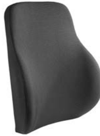
Respaldo SEDEO LITE Active, Contorno Profundo, con cinchas // QML030133