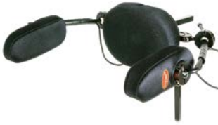
Mando pulsador de cabeza Dual Pro Switch It // QML110370 // QML110371