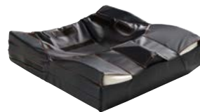
Jay Balance con kit de posicionamiento