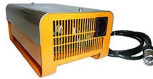
Cargador de 220 V / 8 A, con grado de protección IP54 // QML160102