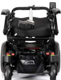
Respaldo plegable // QML030098