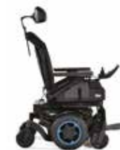
Q300 M Mini

Ingénierie de pointe. Adaptée à vos besoins.