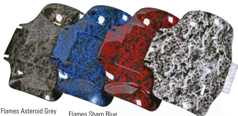
Flames Asteroid Grey