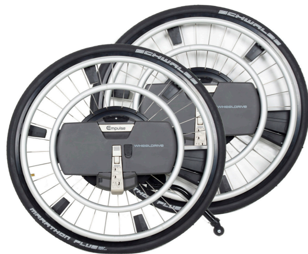
Empulse WheelDrive Drivhjul med elektrisk motor.

Les mer om drivaggregater på vår hjemmeside www.SunriseMedical.no eller i vår katalog Manuelle rullestoler og drivaggregater.