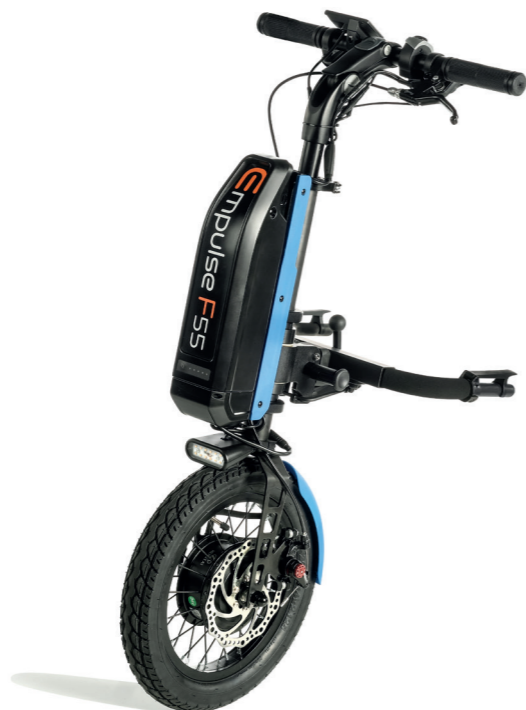
Empulse F55 Drivaggregat med manuell styring.