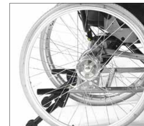
Bubnové brzdy pro doprovod.