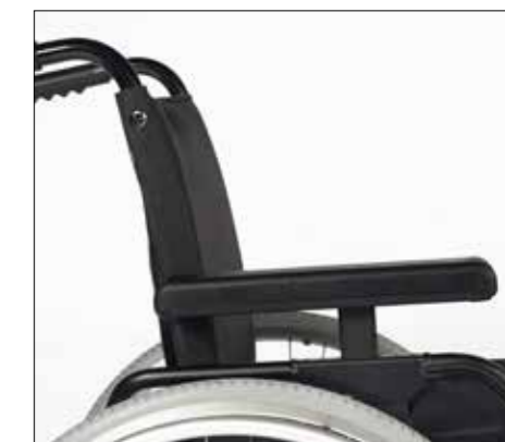
Výškově stavitelné područky. (volitelně)