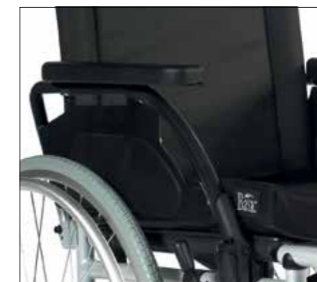
Deskové bočnice. Vзад odklopné bočnice s hloubkově nastavitelnou područkou.