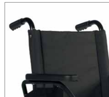
Standardní polstrovaná zádová opěrka. Pevné ručky pro doprovod.