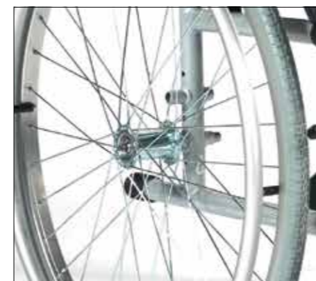
Dvě nastavitelné výšky sedačky. Zadní kola s bezúdržbovým obutím a rychloupínací osou.

UniX 2 je určený pro uživatele, kteří potřebují podpořit svoji mobilitu jak v interiéru, tak mimo domov.