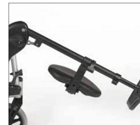
Úhlově stavitelné stupačky. (volitelně)