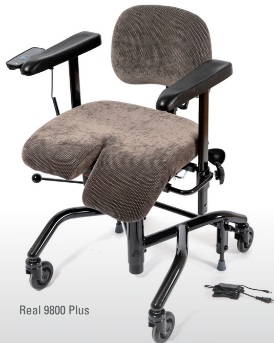
Real 9800 Plus

Den optimale arbeidsstolen for egen kjøring med fot