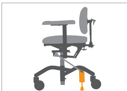
Brems mot gulv gir tryggere forflytning.