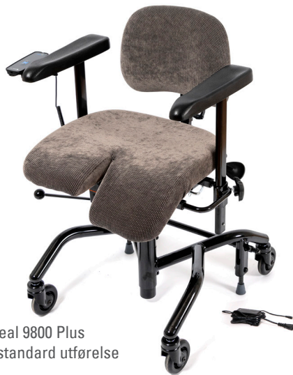
Real 9800 Plus i standard utførelse