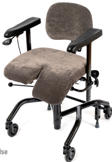
Real 9700 Plus i standard utførelse