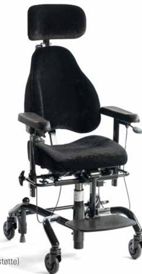
Real 9300 Plus (støtte)