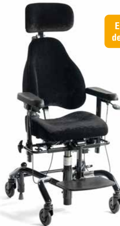
Real 9300 Plus (støtte) i standard utførelse