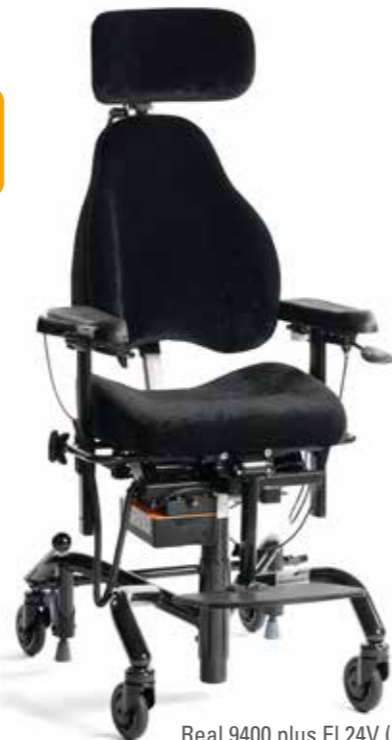
Real 9400 plus El 24V (støtte) i standard utførelse