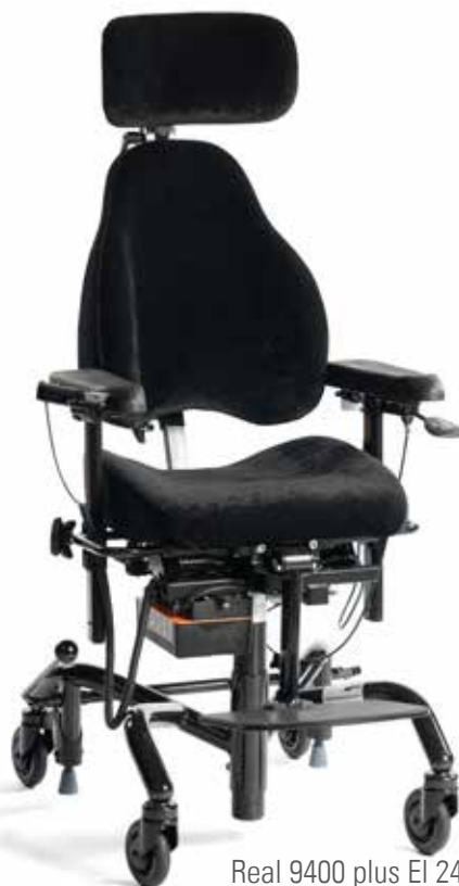
Real 9400 plus El 24V (støtte)