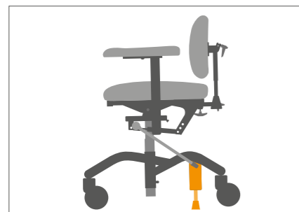
Brems mot gulv gir tryggere forflytning.