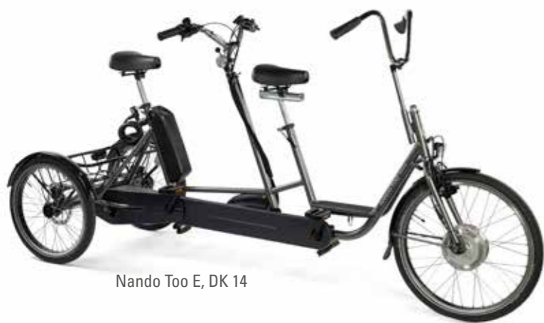
Nando Too E, DK 14

Delkontrakt 14: Trehjuls tandemsykkel med ledsager bak, gir og hjelpemotor, to størrelser barn/voksen 1. VALG