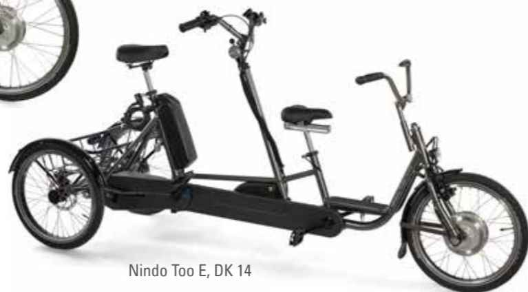
Nando Too E, DK 14