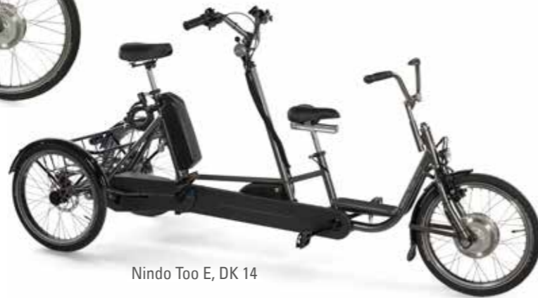
Nando Too E, DK 14