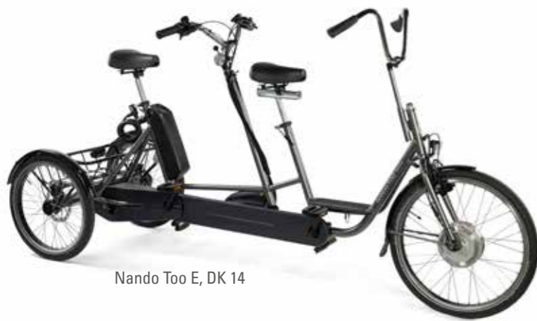
Nando Too E, DK 14

Delkontrakt 14: Trehjuls tandemsykkel med ledsager bak, gir og hjelpemotor, to størrelser barn/voksen 1. VALG